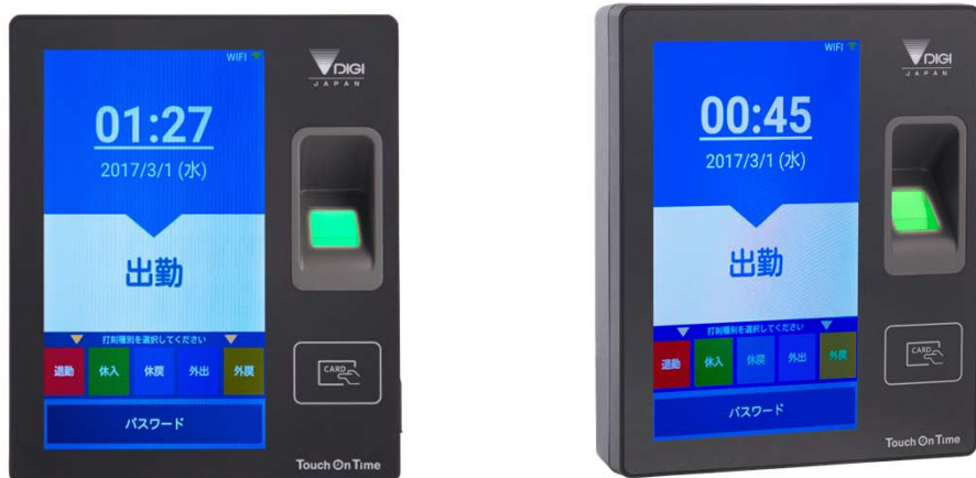
▲ Touch On Time レコーダー And.

また本製品は3つの打刻方法（指紋・ICカード・ID+パスワード）を自由に組み合わせで打刻できます。指紋打刻なら「ピッ」と指をかざすだけで打刻できる簡単さです。出勤・退勤は設定した時間によって自動で切り替わるので、基本的に画面を操作する必要がありません。